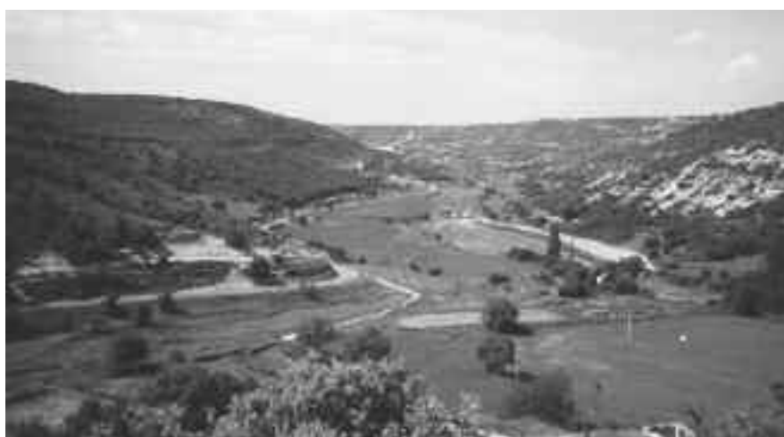
FOTOGRAFÍA 1. Aspecto del Arroyo de la Vega